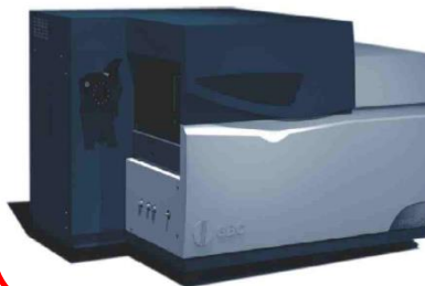
感應耦合電漿質譜儀 GBC Optimass ICP-MS

原子螢光汞砷分析 PSA Merlin & Excalibur 利用原子螢光法搭配氫化裝置對汞砷元素進行精確地分析