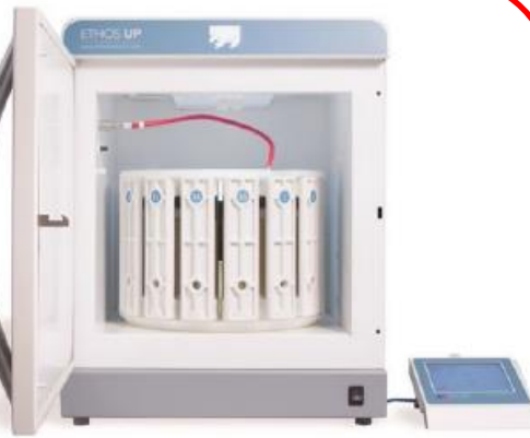
微波消化前處理 Milestone Ethos UP